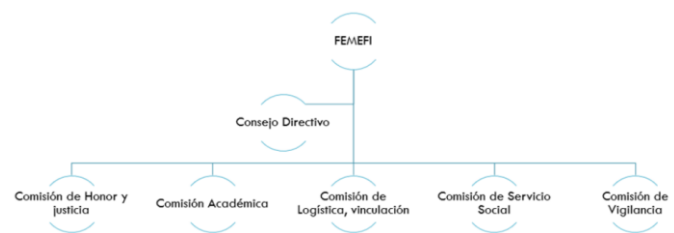
Ilustración 1.- Diagrama conformación de la FEMEFI

La Federación Mexicana de Fisioterapia, Terapia Física, Kinesiología y Terapia Física (FEMEFI), está organizada de la siguiente manera para cumplir sus objetivos, obligaciones y demandas que el gremio solicita; su organigrama es esencialmente integrado por un Consejo Directivo y diversas Comisiones (Ilustración 1).